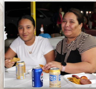
FIESTA DE NTRA. SRA. DE LA ALTAGRACIA 01.21.2025